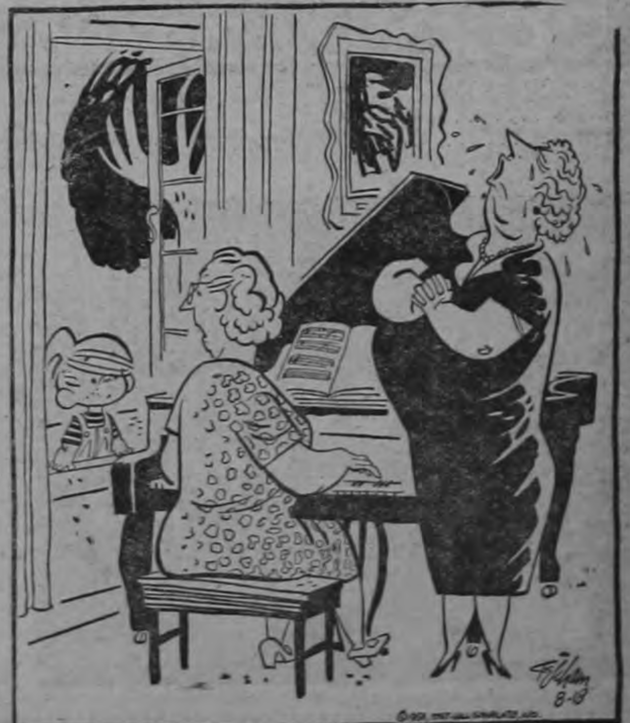
No; no le duele nada... Está cantando solamente...