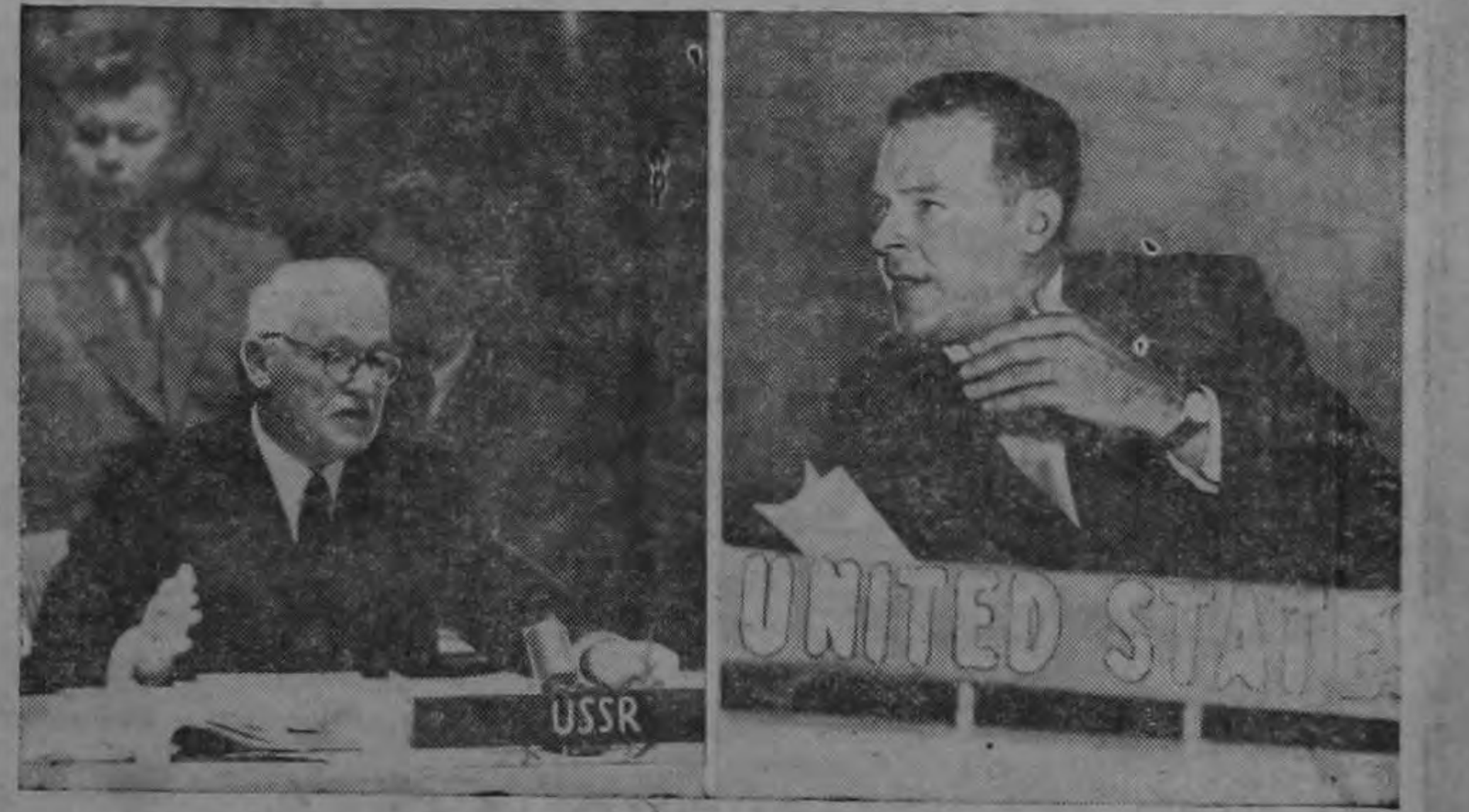
VISHINSKY PLANTEA EL CASO DE TRIESTE. El delegado soviético, Andrei Vishinsky (izquierda) plantea el explosivo caso de Trieste ante el Consejo de Seguridad en Nueva York, pidiendo que se restaure la administración internacional sobre el territorio libre. Calificando la demanda rusa de "otra estratagema propagandista" el Embajador de los Estados Unidos Henry Cabot Lodge Jr., (derecha) dice que no se opondrá a la resolución de Vishinsky.