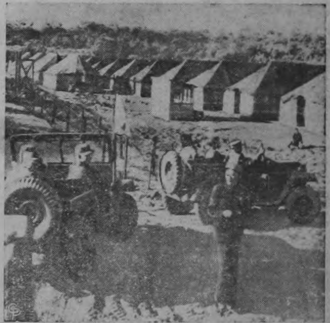
SE DISPONEN A ENTREVISTAR A LOS NORTEAMERICANOS QUE NO QUIEREN SU REPATRIACION. Jeeps aparecen frente a la pequeña ciudad de tiendas en Panmunjom donde personal de las Naciones Unidas entrevistará a los 23 norteamericanos y a los sudcoreanos que no quieren ser repatriados.