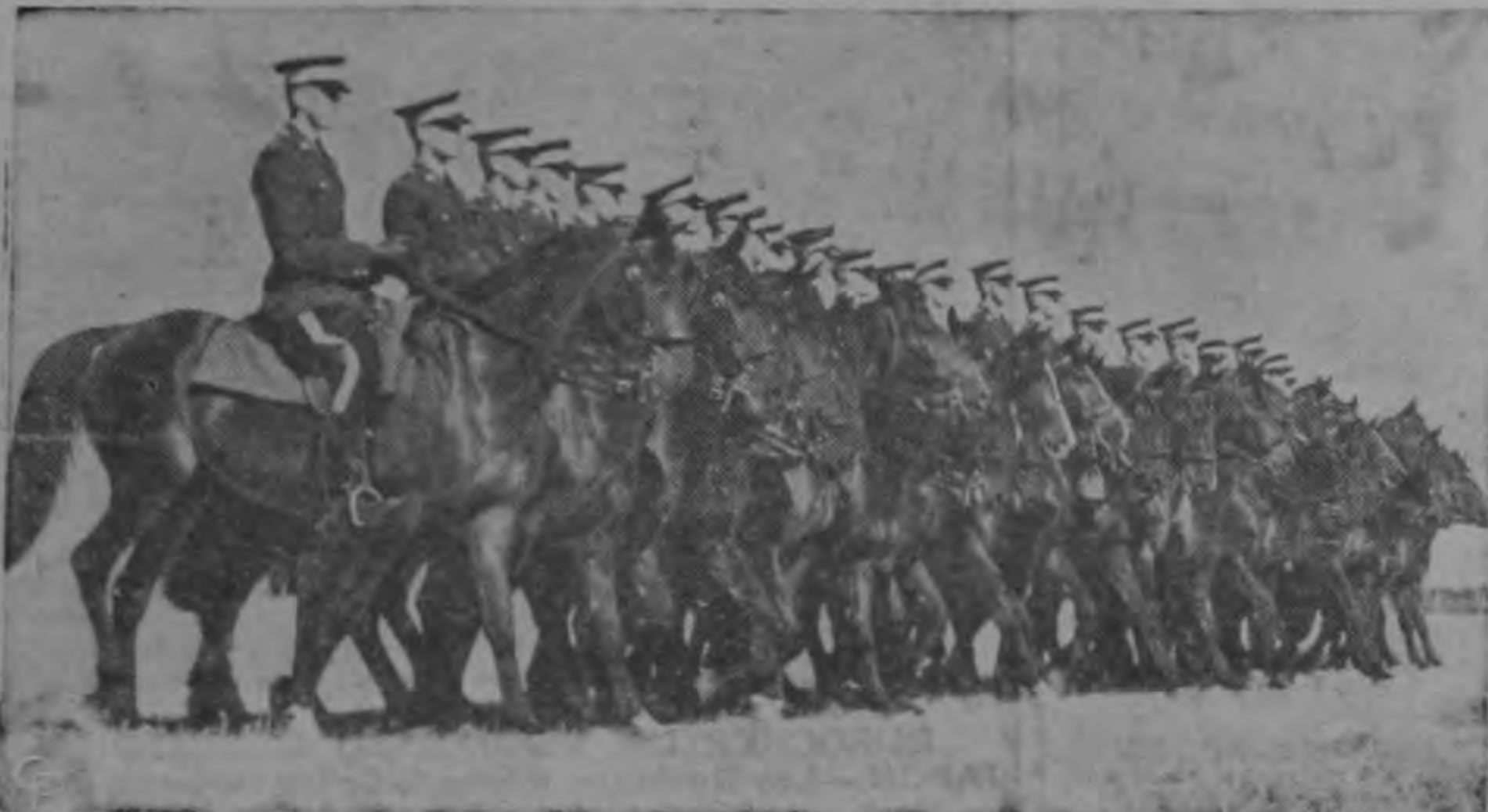
La Real Policía Montada del Canadá, con chaquetin rojo, sigue entrenando a sus hombres en el arte de la equitación

Los montados usan todavía la túnica escarlata que atemorizó a los indios Por: H. D. CRAWFORD