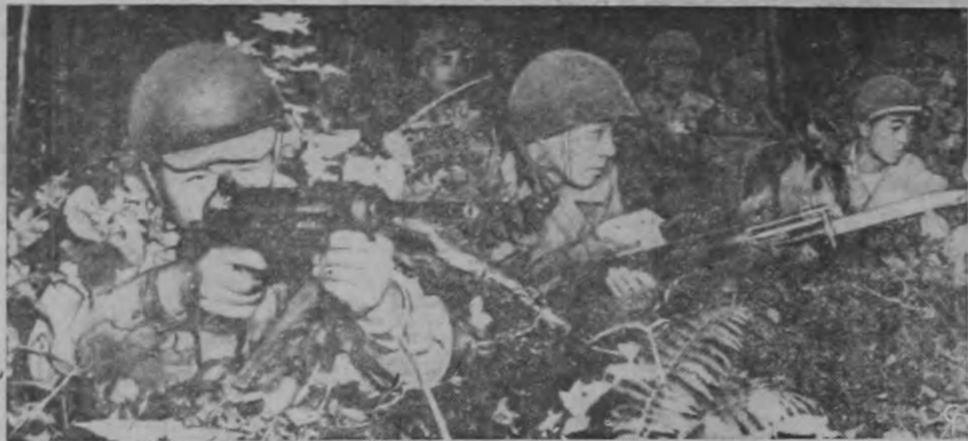
MANIOBRAS DE LA FUERZA DE SEGURIDAD DEL JAPON.— Equipados con uniformes, armas, tanques y aviones norteamericanos miembros de la Fuerza de Seguridad Nacional del Japón de 110.000 hombres efectúan maniobras en las vecindades de Sapporo, en la isla de Hakkaido.